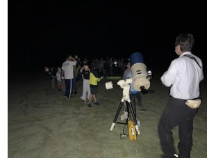
大きな天体望遠鏡で金星・木星などを観察