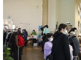
古着や日用品雑貨、竹細工製品、観葉植物など様々な出店が揃いました。