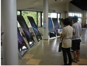
関金の星空タペストリー