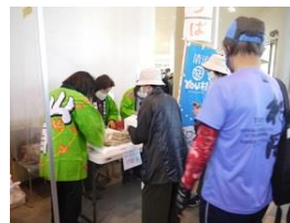
遊 YOU 村—おこわ販売