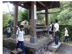
鐘をついてウォーキングに出発