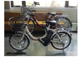
新たに購入したアシスト自転車

昨年度からスタートしたレンタサイクル事業では、今後の需要の回復を見越し、今年度は、利用者からも要望があった電動アシスト自転車を導入しました。また、関金地区振興協議会と連携し、地元住民のお勧めスポット“関金世間遺産、を掲載した散策 MAP の改訂版を作成、町内や周辺施設に配布することで、更なる地域の魅力発信をはかりました。