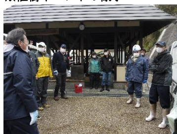
延命茶屋足湯集合