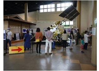
ミッションの軌跡パネル