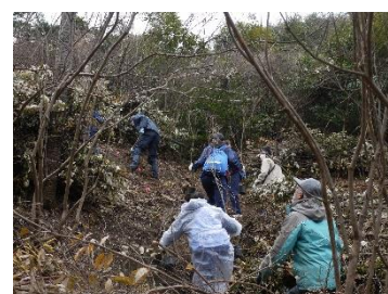
公園遊歩道沿い斜面