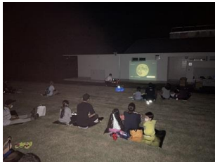
市営ラグビー場にて