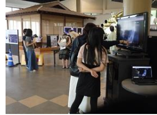
次のミッションに向かうはやぶさ2