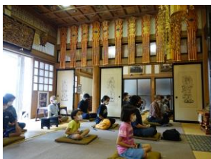
地蔵院での瞑想体験