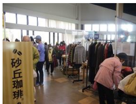
宝製菓—お菓子と珈琲販売