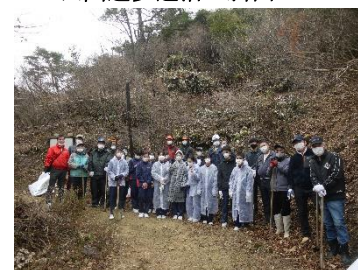
植樹活動記念撮影