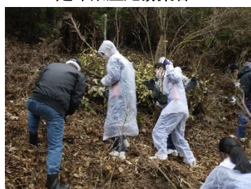
地域の方と中學生がグループごとに植樹