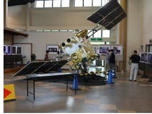
はやぶさ2実物大模型