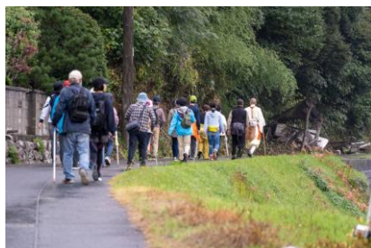
地蔵院住職と関金宿～地蔵院奥の院へ