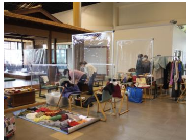
← フリーマーケット